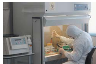
Los investigadores encontraron que combinar los virus oncolíticos y el uso de inhibidores de puntos de control curaba del 60 al 90 por ciento de los ratones, en comparación con cero para el inhibidor del punto de control solo y del 20 al 30 por ciento para el virus solo.