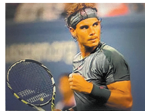
El español se ha estado recuperando de una lesión en la cadera que lo obligó a retirarse del calendario de tenis en el 2023.