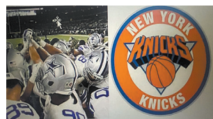
El valor global del mercado deportivo en todo el mundo alcanza la cifra de 512,14 millones de dólares en el año 2023.

El mundo del deporte profesional es un negocio en auge que beneficia no solo a las televisiones y organizadores, sino también a los jugadores, el personal y los propietarios de cada una de las franquicias y equipos. Si nos enfocamos en Estados