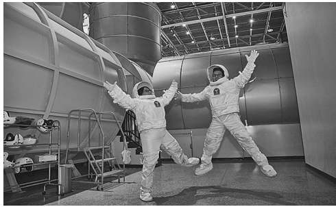
Fotografía sin fechar cedida por National Geographic que muestra a dos periodistas mientras participan en una visita para los medios en el Space Camp, en Huntsville (EE.UU.).EFE/Jon Morgan/Cortesía National Geographic/SOLO USO EDITORIAL/NO VENTAS

Aunque no tiene la fama de Houston o Cabo Cañaveral, Huntsville también cuenta con una gran historia aeroespacial, hasta el punto de que su apodo es "The Rocket City" (La ciudad de cohetes).