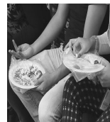
El estrés puede provocar problemas de concentración, ansiedad, angustia, desesperación, somnolencia, fatiga crónica, desganado y aumento en el consumo de alimentos -sobre todo carbohidratos-, alertó hoy una especialista.

"Nuestro organismo busca el equilibrio, pero cuando algo sale de control y